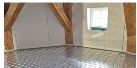
Schneller Baufortschritt durch einheitliches Verlegeraster der Heizelemente