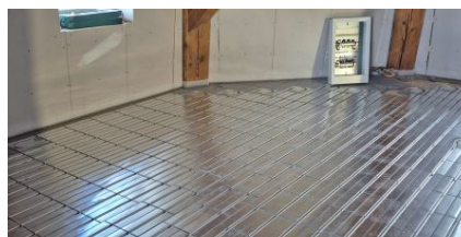
Optimale Wärmeverteilung über Aluminium Wärmeleitbleche