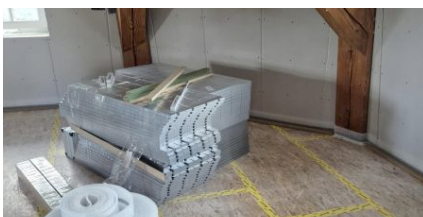
IDEAL CLASSIC NEO 20 Heizelemente und Rahmenholz